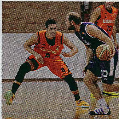
Polo marca Adami, ex contro a San Daniele; la Bluenergy riparte con Pontisso, in palleggio, e Nata

Bluenergy. Codroipo torna subito a sorridere grazie al 61-77 affibbiato alla Radenska Trieste, priva di Bole e Meden. Ancora una volta il collettivo co-