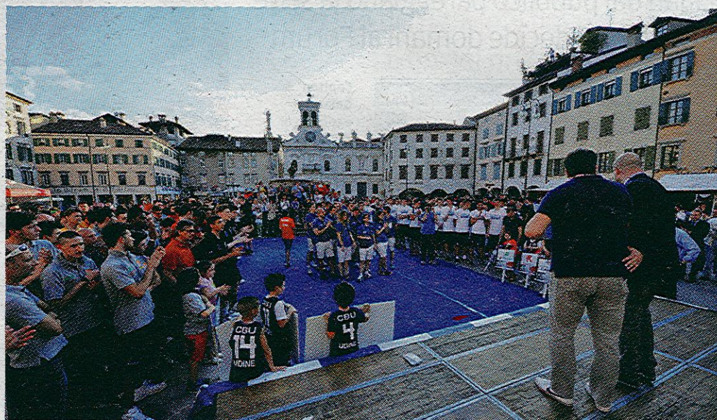
In piazza San Giacomo ieri c'è stata la cerimonia di apertura delle finali nazionali U19 a 16 squadre

In base alla formula le 16 squadre sono state divise in 4 gironi, le cui gare si dispute-