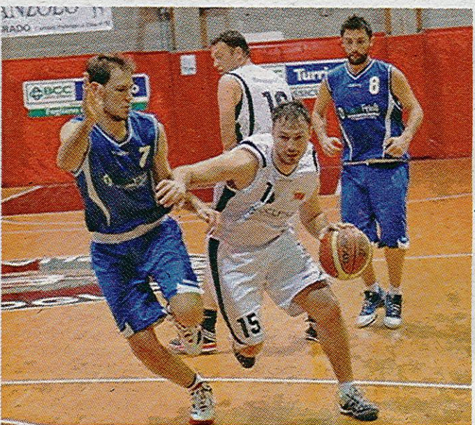
Ok Aibi di Matteo Piani ai play-off e Abc di Cargnelutti ai play-out (F. Zamolo)

CASARSA e ALBA salve, MAZZILLIS CBU, GEMONA e MANIAGO retrocesse in Promozione