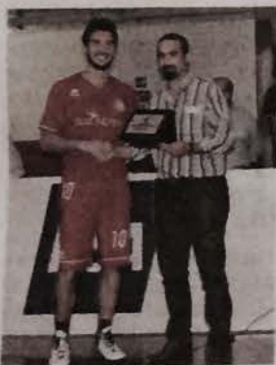
Tarcento corazzata, Pontisso Mvp e Girardo miglior giovane a San Daniele