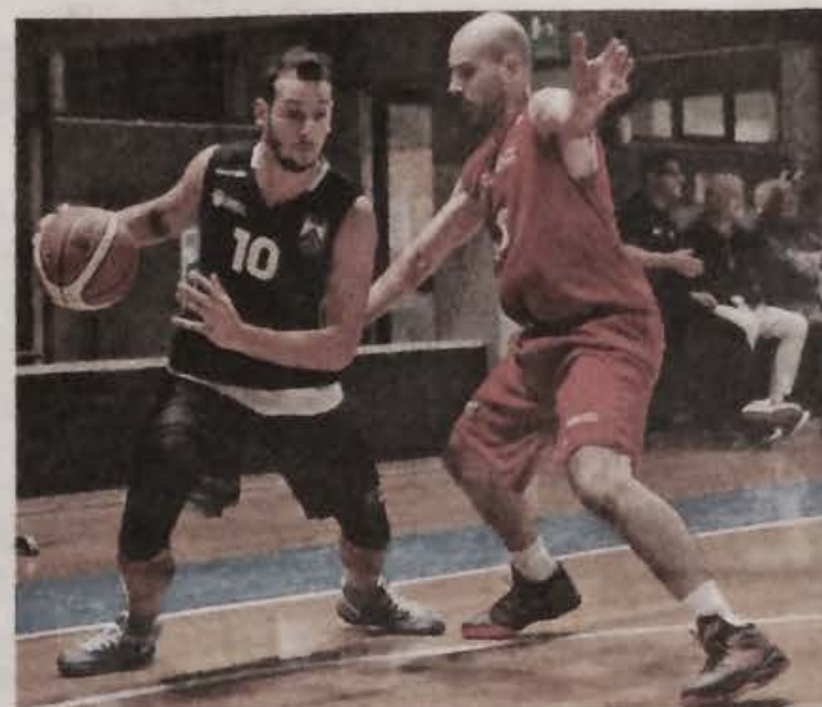
Di Viccaro è sotto osservazione per un "lopez" contro Trieste

dalla prima, per Bergamo, Fortitudo Bologna, Lugo e Urania Milano. I neopromossi orobici di coach Galli (Bona, Cortesi, Chiaro, Magini, Masper e Zanelli) sono solidi sotto canestro, ma devono convincere in regia. Bo-