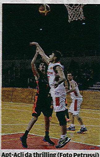
Apt-Acli da thrilling

Serie C Fvg. Decima d'andata: ieri, Fluidsystem80 Tarcento (16 punti in classifica) - Radenska Bor Trieste (6) 87-51, Metallica Tolmezzo (6) - Eppinger Don Bosco Trieste (12), 84-77, Bluenergy Adp Codroipese* (16) - Ronchi* (0) 101-52, Trevisan Latisana* (8) - Il Michelaccio San Daniele (14) 77-86, Ferroluce Asar Romans* (8) - CrediFriuli Abc Cervignano* (4) 98-86 e Geoclima Aibi Fogliano* (8) - Lussetti Servolana* (10) 60-68; venerdì, Latte Carso Ubc Udine* (6) - Blue Service Collinare Fagagna* (12) 77-58; a riposo Breg San Dorligo* della Valle (14) *una gara in meno.